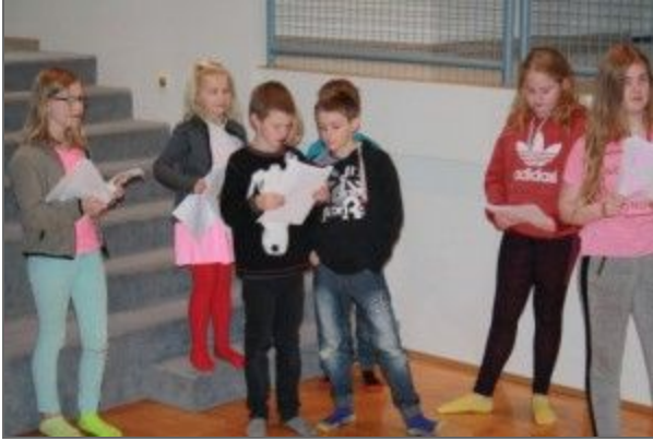
Frá æfingu í fyrra

Vegna ýmissa óviðráðandi orsaka, ætlum við að færa árs hátíð okkar til 30. nóvember n.k. Á skóladagatali var hún áætluð þann 16. nóv. og færum við hana því um 2 vikur. Nemendur fengu handritið í hendurnar í gær og er vinnan hafin á fullu.