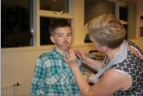
Förðun frá fyrra ári