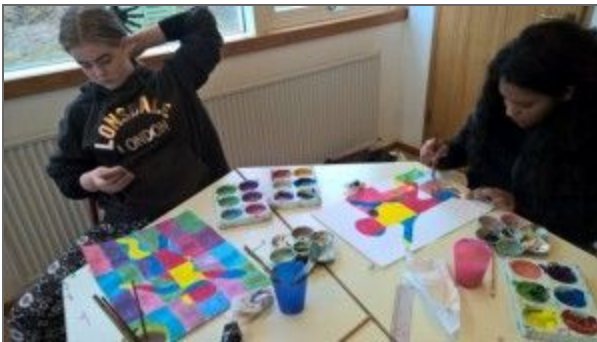
Aðeins að kíkja í símann!!!