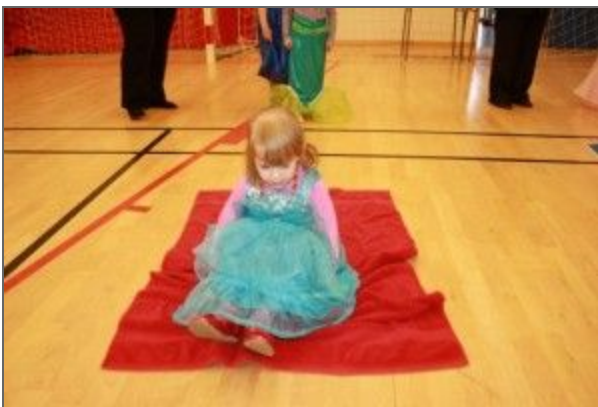
Prinsessa á handklæði.

03. mars 2017 - Björgvin Valur Guðmundsson