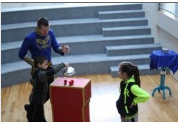
Merkilegt hvernig þessar rauðu kúlur komu og fóru

08. mars 2017 - Björgvin Valur Guðmundsson