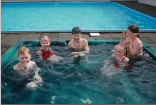
Slökun í pottinum.

Sundkennslan hefst föstudaginn 28. ágúst. Kennt verður í 3 hópum í sex daga. Kennsludagarnir verða: 28. ágúst, 31. ágúst, 4. sept., 7. sept., 14. sept. og 18. sept. Kennari verður Vilberg Jónasson, íþróttakennari við Grsk. Fáskrúðsfjarðar.