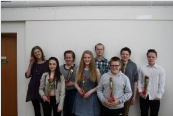
Frá skólaslitunum í fyrra