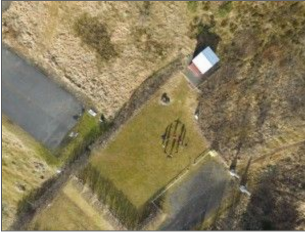
Skuggalegt, alveg hreint