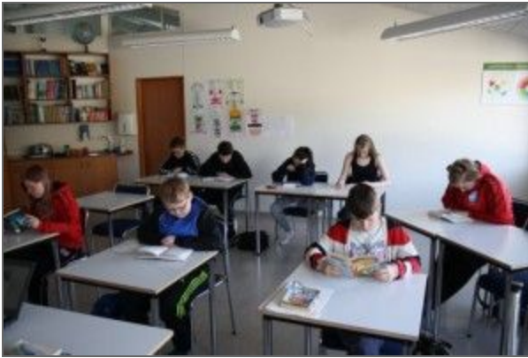
Læsi í fyrirúmi.

Nemendur kl. 8.05 á mánudagsmorgni. Við byrjum alltaf á yndislestri fyrsta korterið á skóladeginum. Hér má sjá alla á eldra stiginu niðursökkna við lesturinn.